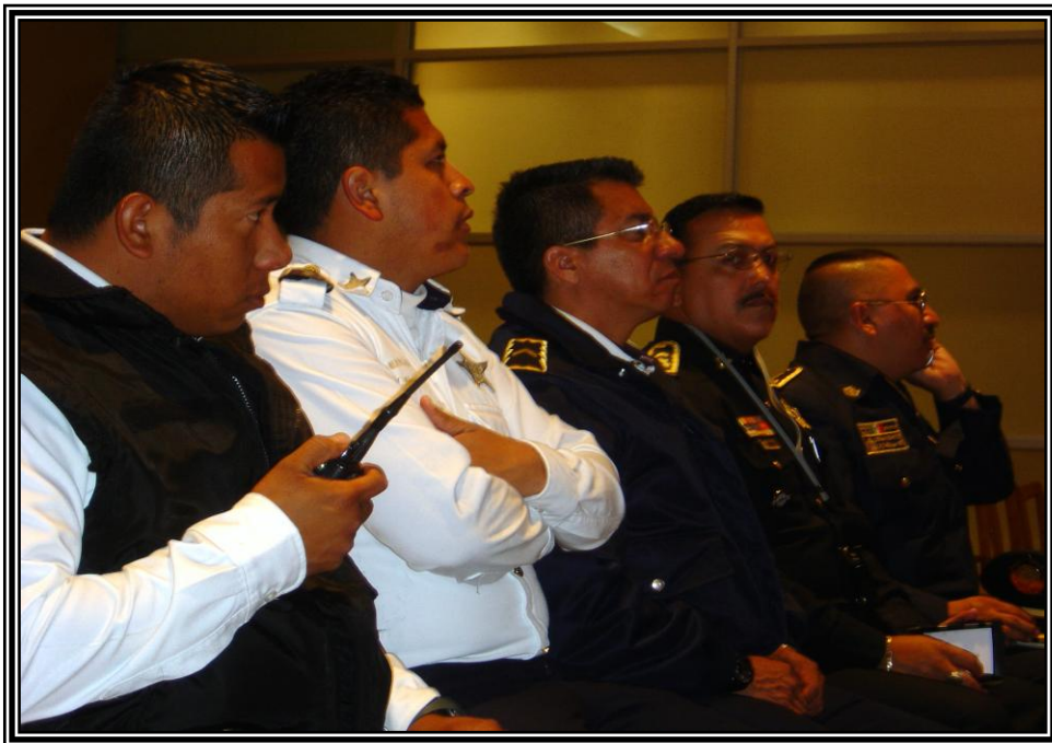
*Algunos oficiales de policía asistentes a la mesa

En un trabajo realizado con policías municipales de Guadalajara, se ha podido observar el sentido de las trayectorias, de los motivos de los procesos de ingreso y socialización policial en los que los sujetos constatan la necesidad de optar entre los caminos que la institución les reserva para sobrevivir dentro de ella: permanecer, corromperse, aislarse o salir . Ese espacio de ambigüedad, en el que nadie está libre de sospecha, se refleja cuando el policía expresa que en el horizonte de su carrera policial sólo ve dos futuros: el panteón o la cárcel .