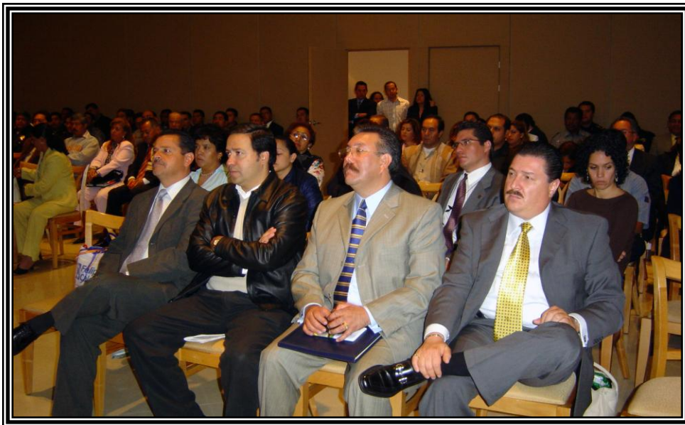
*Entre los asistentes, autoridades del Municipio de Naucalpan

Agradecemos particularmente al municipio de Naucalpan por permitir esta reunión. Reconocemos que, a través de la Dirección General de Seguridad Pública y Tránsito, ha mostrado un profundo compromiso con el proceso de desarrollo y mejoramiento institucional de la policía, propiciando siempre la participación de actores internos y externos a los cuerpos policiales.