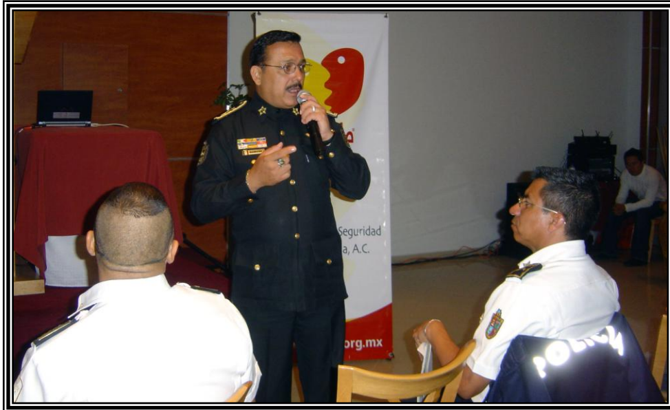
*La participación de los oficiales de policía fue copiosa.

nuevas instituciones policiales más democráticas. Por desgracia, la sociedad no ha querido, por ejemplo, participar en los consejos ciudadanos . Sólo un pequeño grupo de notables ha aprovechado estas oportunidades, lo que deja al resto de la sociedad en una posición marginada de las decisiones sobre seguridad pública.