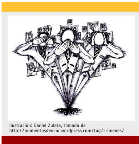
Ilustración: Daniel Zuleta, tomada de http://momentosdeocio.wordpress.com/tag/crimenes/

“De acuerdo a la entonces Procuradora, se teme que el migrante solicite una visa humanitaria, por ejemplo, fingiendo un robo en un albergue para poder seguir en su viaje, o que elementos del crimen organizado pudieran hacerse pasar por víctimas para conocer los procedimientos de las instituciones públicas.”