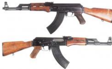
CALIBRE 7.62 X 39 mm FABRICANTE: Izhevsk Mechanical Works

La popularidad de esta arma obedece a que es un rifle muy ligero, de gran exactitud y relativamente económico ya que en algunas regiones de mundo, como es el caso de Asia se le puede conseguir en menos de 100 dólares, mientras que en America del Sur puede llegar a costar hasta 2 mil dólares en el mercado negro. Los industriales de la AK-47 estiman que desde su invento se han fabricado 100 MILLONES de estos rifles de asalto.