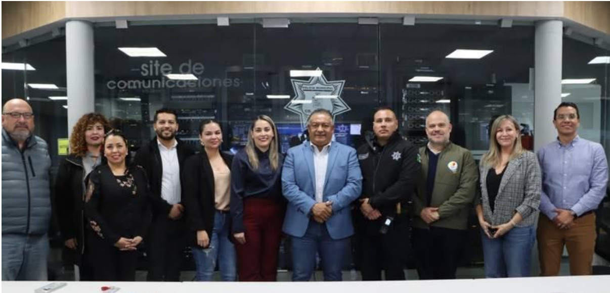
Policía Municipal de Ciudad Juárez, Chihuahua

Tras una exhaustiva revisión tanto de equipamiento, como de instalaciones, unidades y personal, la SSPM obtuvo un 98% de aprobación.