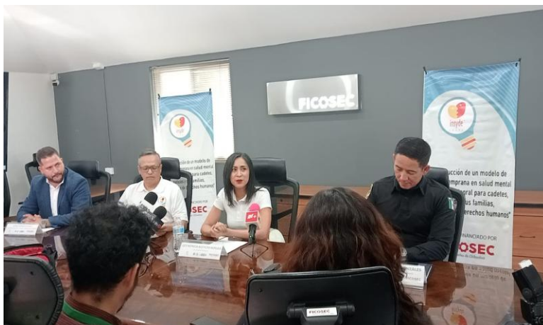
Rueda de prensa para presentación del proyecto del modelo integral de bienestar y salud mental.

Las actividades que se realizan en el marco de este proyecto tienen un enfoque de derechos humanos, género e inclusión social, promueve el tratamiento de problemas psicoemocionales y busca el fortalecimiento de factores psicosociales de protección que retoman los retos, necesidades e intereses estratégicos de agentes y cadetes de policía. El personal policial que reciben apoyo para su bienestar integral puede tener un mejor desempeño en su empleo, toma de decisiones más claras y una mayor seguridad tanto para ellos mismos como para la comunidad a la que sirven.