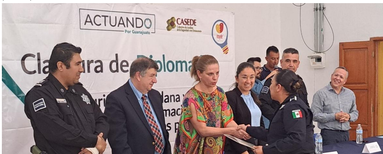
Diplomado “La seguridad ciudadana y el uso de información en instituciones policiales”

En total, 172 agentes policiales concluyeron satisfactoriamente el proceso formativo en formato presencial y 42 agentes concluyeron el diplomado en su formato virtual, consolidando una experiencia de capacitación territorializada, con enfoque práctico y orientada a la mejora del desempeño operativo y preventivo de las instituciones participantes.