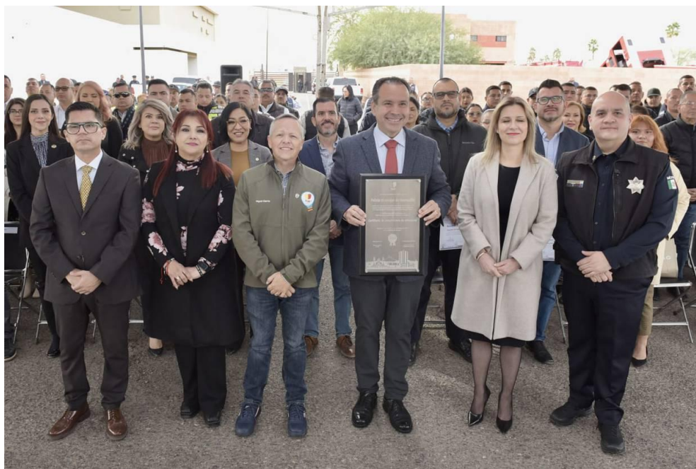
Policía municipal de Hermosillo, Sonora

Hermosillo cuenta con 1200 agentes policiales, que aplicarán procesos y procedimientos profesionales y adaptados a las mejores prácticas nacionales e internacionales, sometiéndose además a un proceso riguroso de revisión y mejora continua por parte de un comité ciudadano de evaluación.