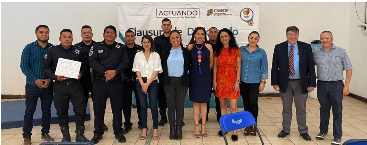
Diplomado “La seguridad ciudadana y el uso de información en instituciones policiales”