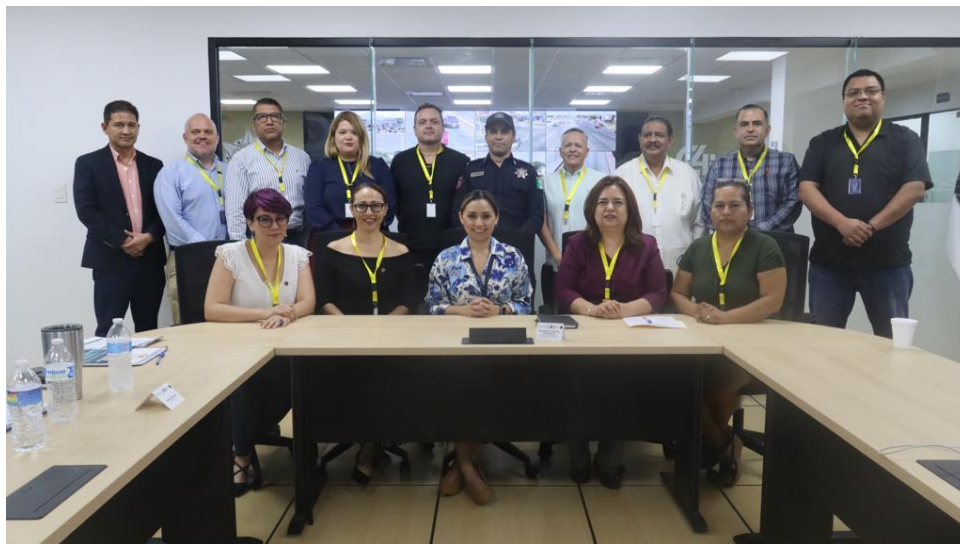
Policía de Guadalupe, Nuevo León.

El Municipio de Guadalupe registró una baja en los delitos patrimoniales de -35%, robo a negocio - 36.88%, robo a casa habitación del -33.53%, robo a vehículo de -30.19% y robo a transeúnte con - 37.5%, de enero a junio comparado con el mismo periodo del año pasado, de acuerdo con cifras del 911.