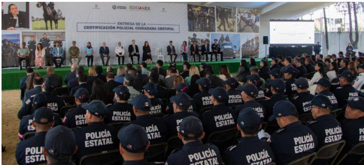
Policía del Estado de México

El titular de seguridad puntualizó que también es un compromiso irrenunciable con la ciudadanía de proteger y garantizar el pleno ejercicio de sus libertades, pues estas iniciativas favorecen significativamente el actuar de quienes conforman la Secretaría de Seguridad.