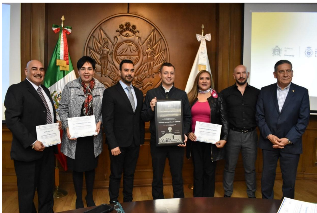
Policía municipal de Monterrey, Nuevo León

El 15 de febrero de 2024 como parte de un proceso exhaustivo para el fortalecimiento de los procesos operativos y administrativos de la policía de Monterrey, Nuevo León. La policía de Monterrey logró la certificación policial ciudadana con el 99% de cumplimiento en los estándares, después de más e un año de acompañamiento por parte de Insyde.