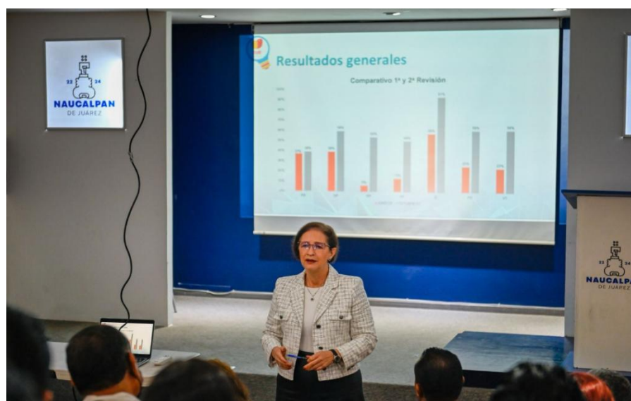
Policía Municipal de Naucalpan, Estado de México Sesión de presentación, comparativo de primera y segunda revisión.

Naucalpan es uno de los pocos municipios del país cuya policía municipal está en proceso de certificación, hasta diciembre de 2023 contaba con el 58 por ciento de avance en el cumplimiento de los estándares, lo que permitirá a la corporación contar con protocolos para desempeñar su trabajo de manera más profesional y prevenir actos de corrupción. Se espera que para 2024 la policía municipal pueda conseguir la Certificación Policial.