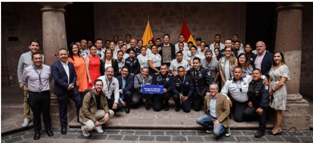
Policía municipal de Morelia, Michoacán

En julio de 2023 la Policía de Morelia obtuvo la certificación oficial CERTIPOL, destacando su compromiso con la transparencia, rendición de cuentas y mejora continua en beneficio de la comunidad. El evento de entrega de la placa conmemorativa contó con la presencia del presidente Municipal, el Comisionado Municipal de Seguridad Ciudadana, el Comisario de la Policía Morelia, representantes ciudadanos y expertos en seguridad.