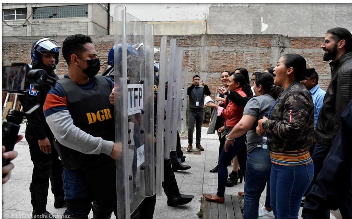
Actividad de cuidado a periodistas en control de multitudes.

Este espacio contó con la participación de instructoras e instructores nacionales e internacionales, quienes aportaron enfoques novedosos para la actuación policial en interacción con medios de comunicación en distintos contextos, como el lugar de los hechos, el control de multitudes y las ruedas de prensa. Asimismo, se desarrollaron mesas de diálogo con periodistas nacionales invitados, quienes compartieron su perspectiva sobre los retos de seguridad que enfrentan en el ejercicio de su labor, así como sus experiencias de interacción con las instituciones policiales.