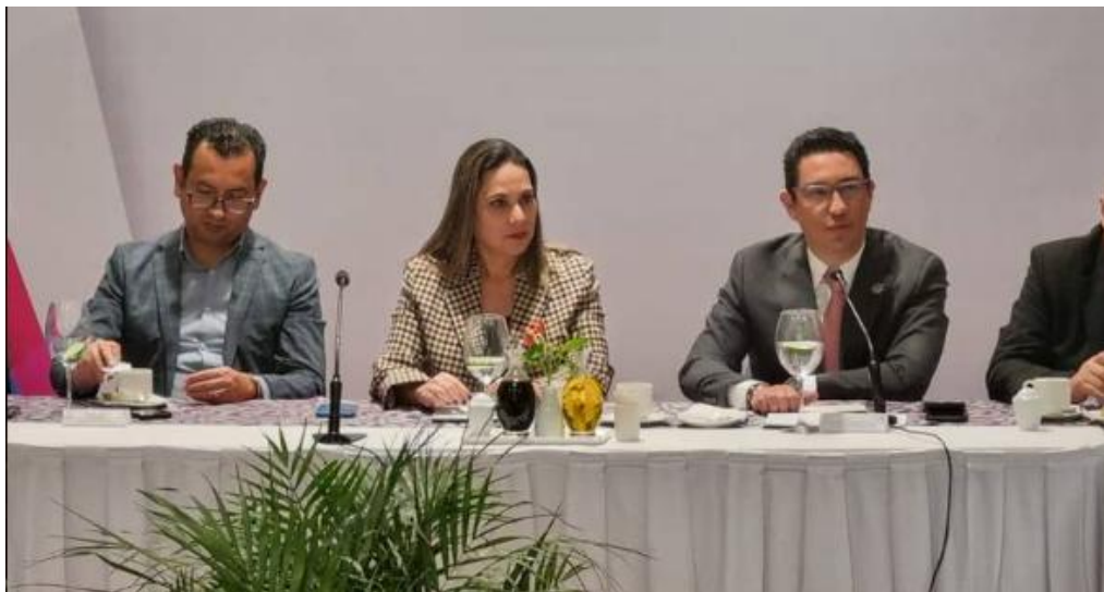
Diálogos Ciudadanos por la paz para la generación de acuerdos, realizados en enero de 2023.