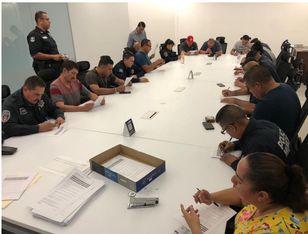
Evaluación preliminar CERTIPOL en Camargo, Chihuahua