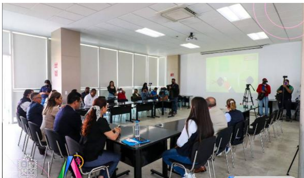
Resultados de la “Encuesta de percepción de Seguridad y Victimización en Irapuato”