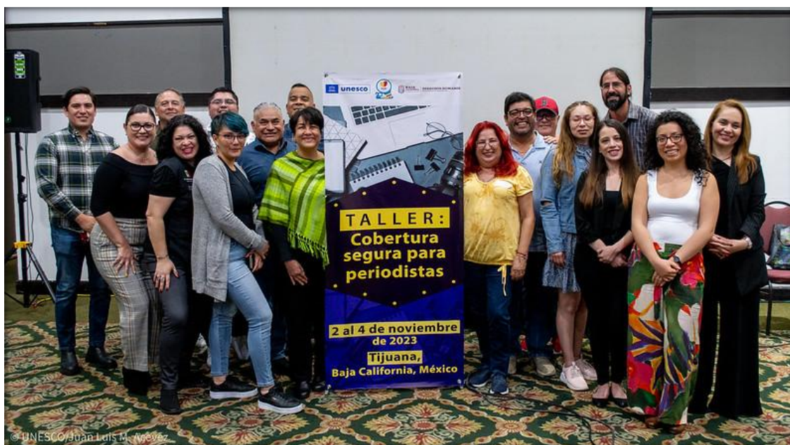
Taller “Cobertura Segura para Periodistas”

La actividad se llevó a cabo con el apoyo de la Subsecretaría de Derechos Humanos de Baja California para la convocatoria y difusión, y fue documentada mediante comunicados institucionales de INSYDE y UNESCO, una memoria fotográfica y un video testimonial, contribuyendo a la visibilización y sistematización de esta experiencia formativa.