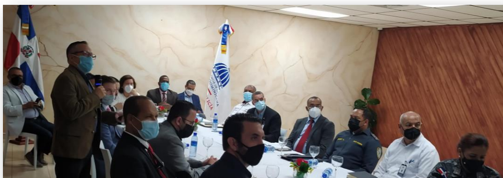
FOTO: Presentación de proyecto ante Ministerio del Interior y Policía Nacional, así como representantes de la Agencia Americana para el Desarrollo Internacional (USAID)

A inicios de 2021, INSYDE recibió la invitación de la Fundación Institucionalidad y Justicia, Inc. (FINJUS) para fortalecer el trabajo realizado por las “Mesas de seguridad, ciudadanía y género”, por lo que se desarrolló la implementación de un Sistema Integral para la Prevención de la Violencia en los municipios de Santiago de los Caballeros, San Francisco de Macorís, Distrito Nacional, Santo Domingo Este y La Romana utilizando la técnica de Intervención Basada en Problemas, como estrategia para la resolución de problemas locales de inseguridad y mejorar la relación comunidad, autoridades locales y policía.