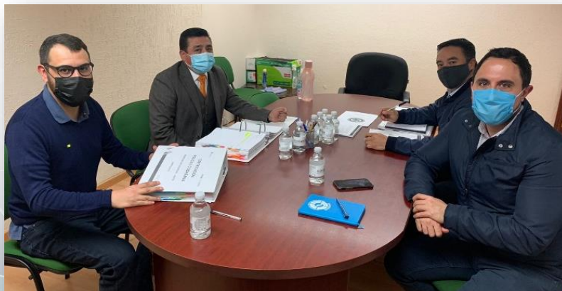
FOTO: Revisión parcial en la policía del Estado de México, como parte del proceso CERTIPOL

Durante 2021 trabajamos con la metodología de Certificación Policial Ciudadana (CERTIPOL) en cuatro municipios del país: Guadalupe, Nuevo León, que concluyó el proceso y obtuvo la certificación; Cuauhtémoc, Chihuahua, que continua el proceso de desarrollo de estándares para certificarse en 2022; Ciudad Juárez, Chihuahua que podría ser la primera policía municipal en obtener la certificación de la metodología CERTIPOL 2.0 en 2022, lo que significa que obtendrá su tercera Certificación Policial Ciudadana; y San Martín Texmelucan, Puebla, que inició el desarrollo de estándares para lograr la certificación del capítulo de Responsabilidad Policial. Además, inició el proceso de acompañamiento para la certificación de la Policía del Estado de México, con lo que podría convertirse en la primera institución policial estatal en obtener la CERTIPOL en 2022.