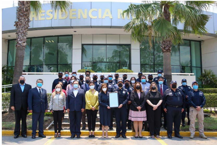
FOTO: Entrega de certificado CETRIPOOL a la policía municipal de Guadalupe, Nuevo León.