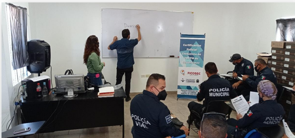
FOTO: Revisión parcial y evaluación a agentes de policía en Cuauhtémoc, Chihuahua, como parte del proceso CERTIPOL

Otra característica de CERTIPOL es que propone la creación de un paquete de lineamientos que aseguran la documentación del uso de la fuerza con el objetivo de que la policía incurra en un sistema de aprendizaje institucional. La captura de un reporte exclusivo del uso de la fuerza en cada intervención policial, su sistematización y análisis permite conocer a fondo las circunstancias en las que los y las agentes toman decisiones en relación con el nivel de fuerza que deben utilizar en una determinada situación. Asimismo, el sistema logra que exista una retroalimentación con la academia y con el área operativa en relación con la factibilidad del protocolo que usan, el equipamiento que portan, el estilo del mando y la discrecionalidad con la que realizan algunas de sus funciones. En este momento, las cinco instituciones policiales que mencionamos con anterioridad son las únicas que, actualmente, cuentan con un sistema formal para documentar y aprender sobre el uso de la fuerza.